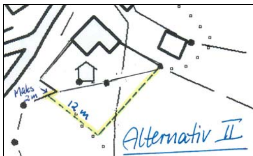
Tillegg til S 568

Fjellstyret godkjenner grensejustering for stølen til Oelschlägel. Fjellstyret meiner det blir ei betre løysing ved å vise ut eit større areal slik at det blir ei rett line frå løe til knekkpunkt på gjerde, vist med stipla line.