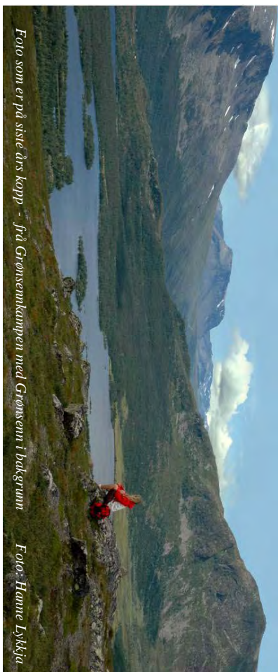
Foto som er på siste års kopp - frå Grønsennkampen med Grønsenn i bakgrunn

Tips: Finn turmål med GPS Dette blir kalla Geocatching og postane finn du på internett.sjå: http://www.gcinfo.no/ eller www.geocatching.com .